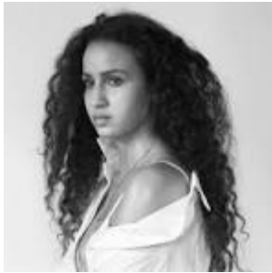
Oulaya Amamra : Lila